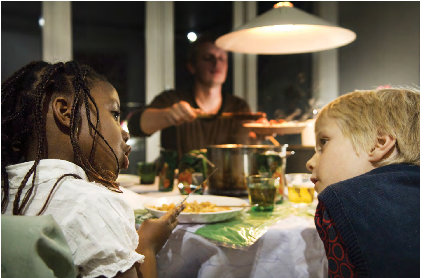
Stemningsbilleder fra "Venner Viser Vej"