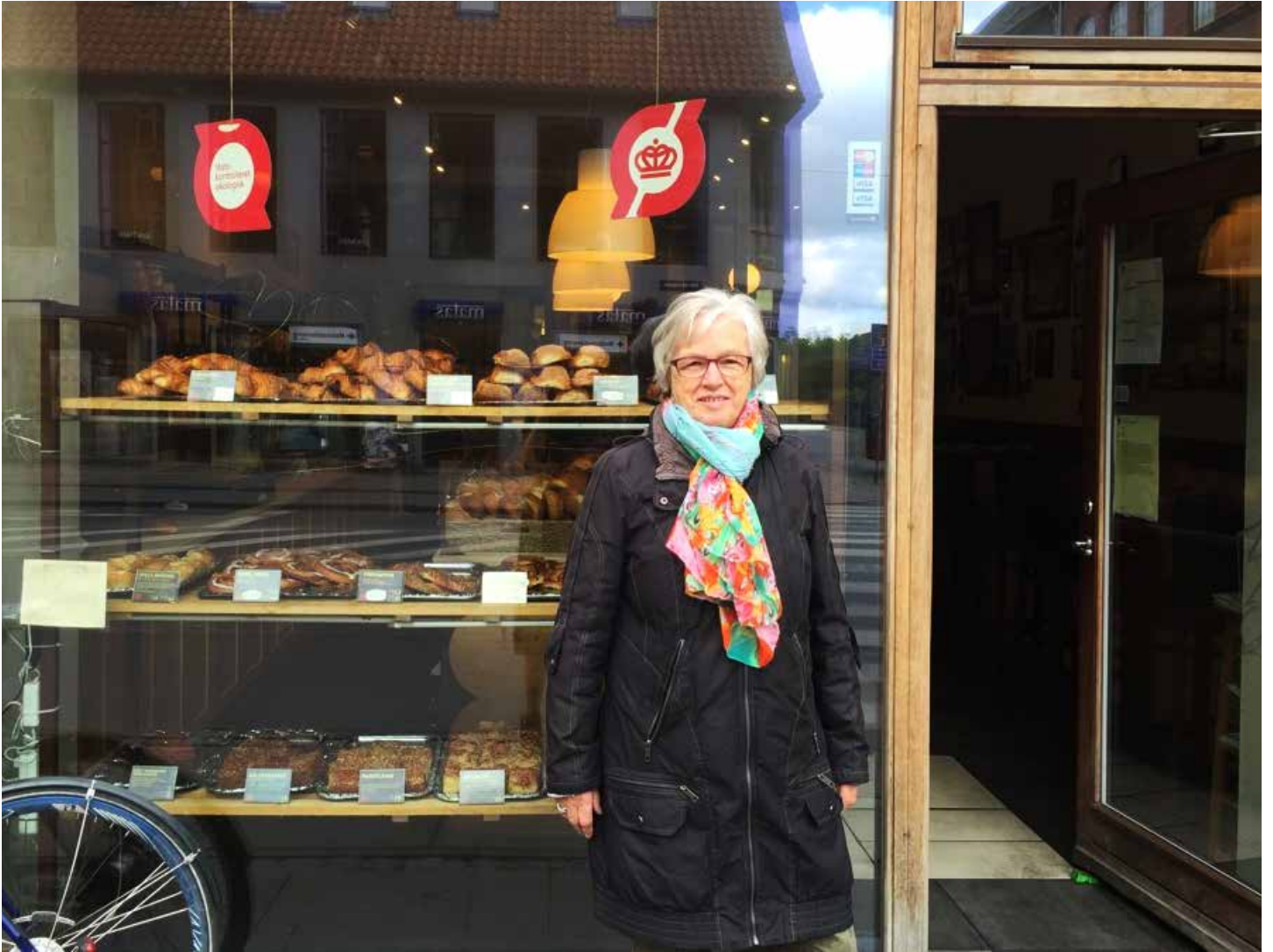
Foto: Jytte Hessellund foran den lokale bager, som en af hendes sønner ejer