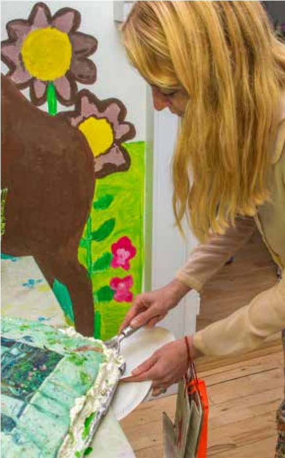
Foto: Den flotte hjemmelavede lagkage skæres for