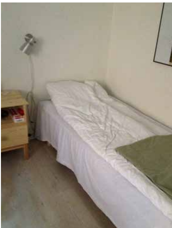
En af sengene på Thorsgade Omsorgscenter

Som det er nu, består centret af en mindre fælles lejlighed og op til otte senge med lille badeværelse. De fleste beboere henvises fra hovedstadsregionens hospitaler, men man kan