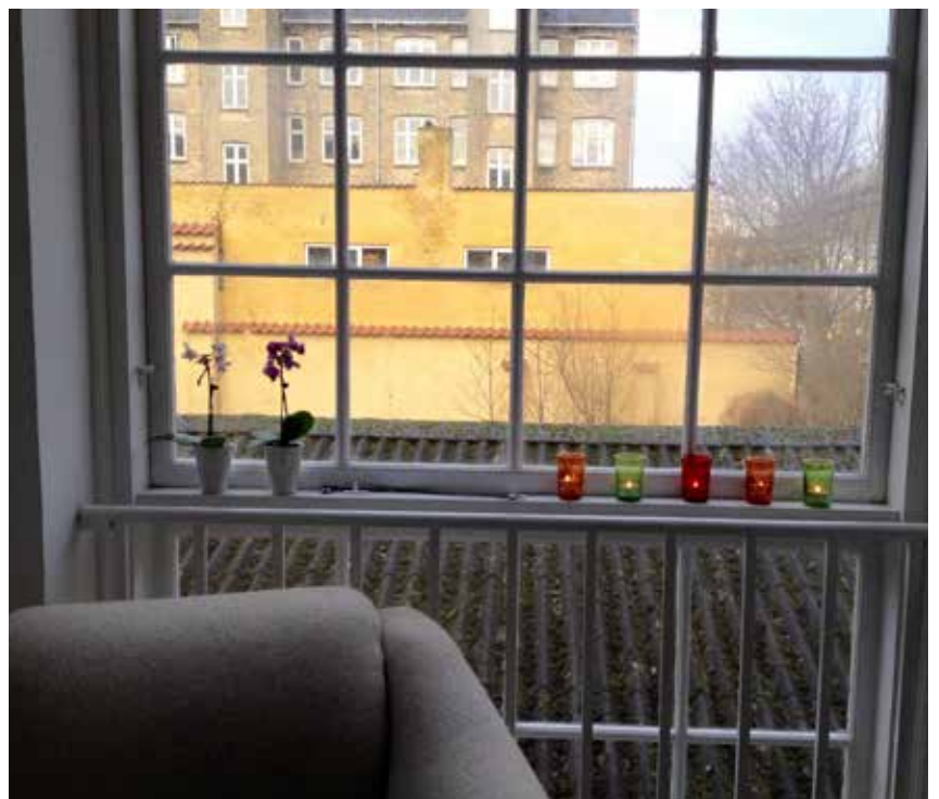
Blomster og stearinlys i vinduerne giver noget hjemlig hygge