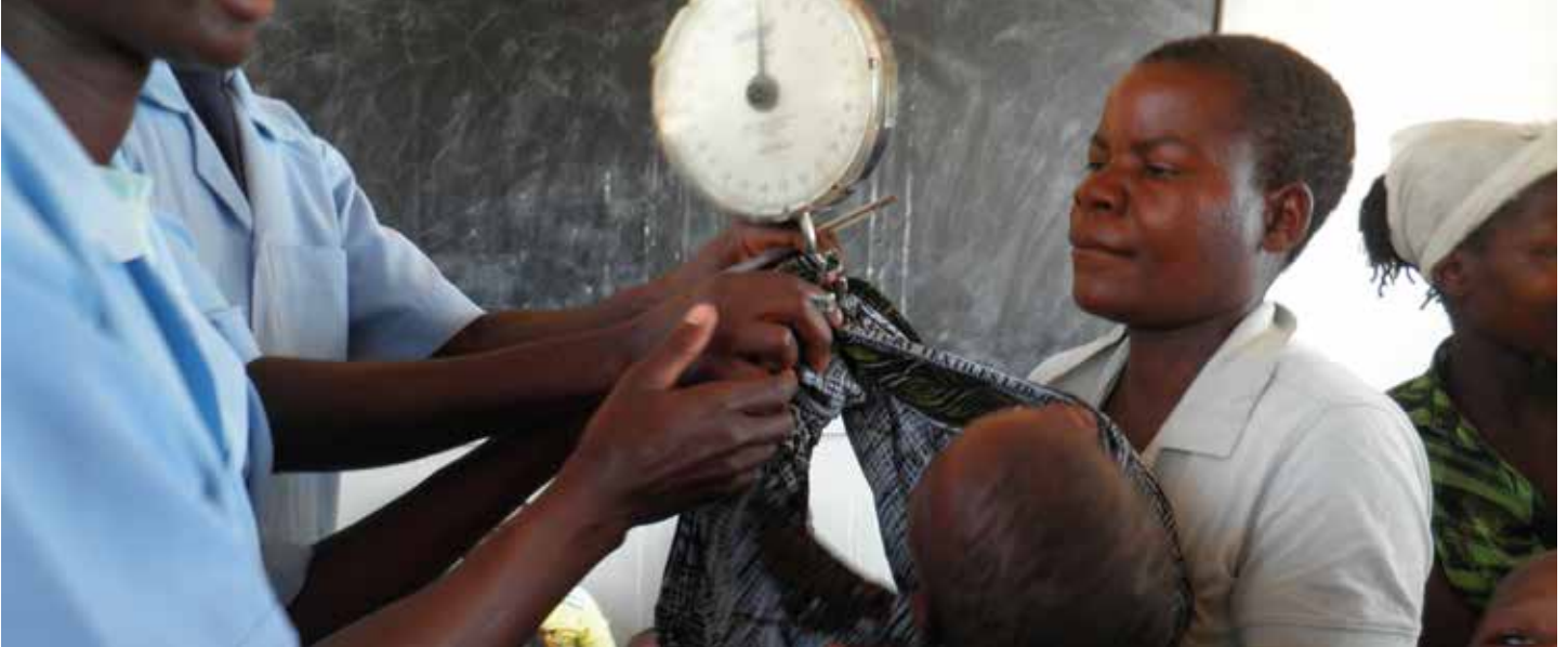
Stolt mor får sit barn vejet på en Røde Kors sundhedsklinik i Zomba.

Tekst og foto af Tom Christensen, aktivitetsleder for den internationale gruppe og næstformand i bestyrelsen for Røde Kors Hovedstaden