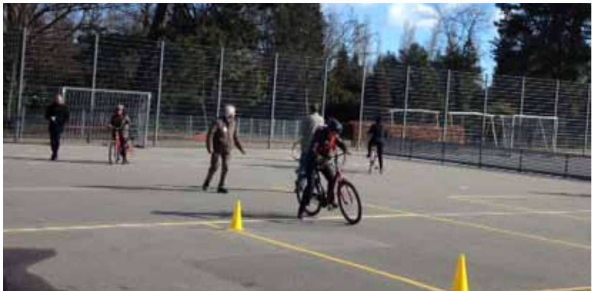
Cykeltid i Hans Tausens park

” Danmark er cyklisternes land, det finder man hurtigt ud af, når man kommer hertil. Det at kunne cykle bliver en vej til frihed, integration og følelse af fællesskab ”