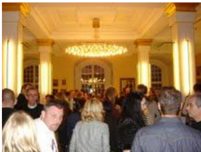
Nytårskur i Snapstinget